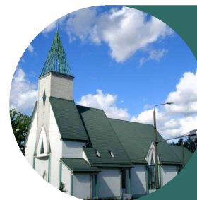
TARTU SALEMI BAPTISTIKOGUDUS

E-post: salem@salem.ee Telefon: 734 3664 Address: Kalevi 76 Tartu 50104 SEB pank: EE461010152001809009 Swedbank: EE832200221005109196